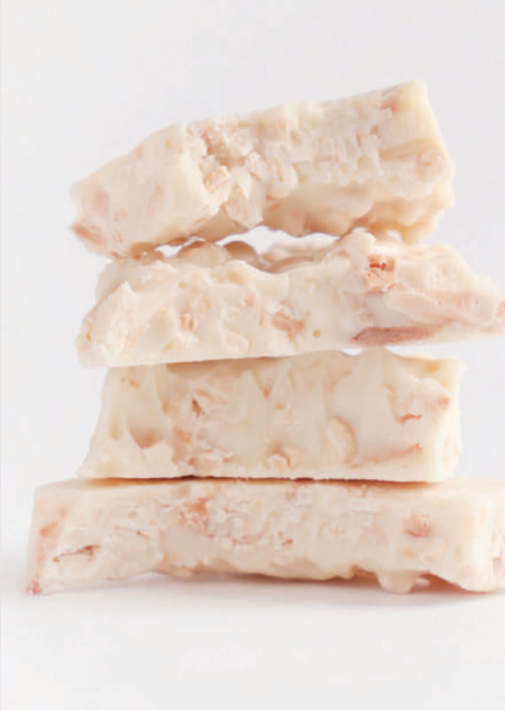
Trencadís d'ametlla torrada i xocolata blanca Pot de vidre de 130 g