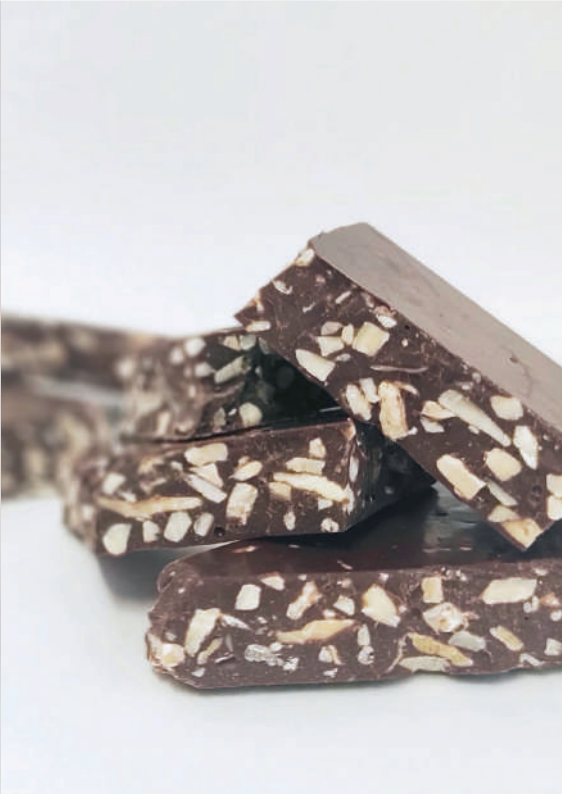
Trencadís d'ametlla torrada i xocolata amb llet Pot de vidre de 130 g